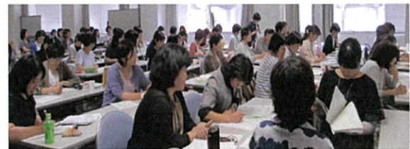
グループワーク導入へ 保健師マーチで 元気づけ