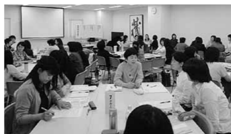
北関東・甲信越ブロック研修会の様子

本ブロックでは、「日頃行っている実践活動を大切に、そこから学びを広げていきたい」との思いから、平成25年度以降各自治体の先進的な活動や人材育成、統括保健師の役割等に関する事例を集めて「実践活動事例集」を作成しています。午後の研修会では、その中から、