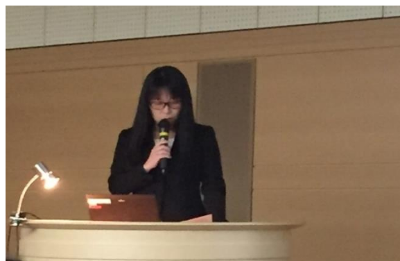
[全国保健師長会 健やか親子特別委員会からの報告]